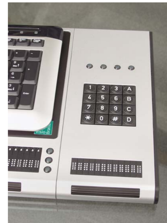
Die Module lassen sich rechts und links von VarioPro montieren.