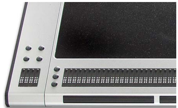
Die Funktionsmodule sind frei konfigurierbar und können rechts oder links an VarioPro montiert werden.