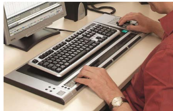
Praktische Funktionsmodule schaffen hochspezialisierte und effektive Arbeitsplatzperipherien.

Braillezeilen mit 80 Zeichen gelten heute als Standard bei Arbeitsplatzausstattungen und in der Ausbildung.