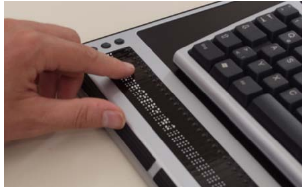
VarioPro bietet eine rutschfeste und großzügig große Fläche für Ihre Tastatur.