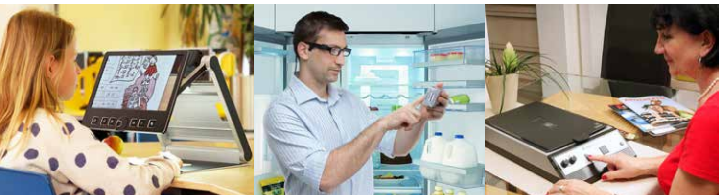
Elektronische Lupen, Bildschirmlesegeräte, Lesekameras, Vorlesegeräte und mobile Assistenzsysteme.

Es ist uns ein Anliegen, unsere Kunden zu unterstützen und ihnen zu helfen, wo wir können.