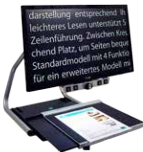
VISIO 22 / 22+