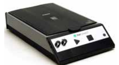
Poet Compact 2 / 2+