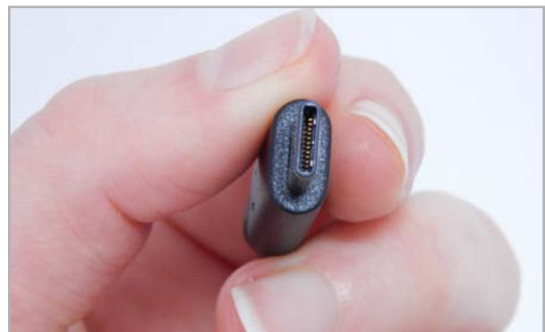
Der USB Typ C Stecker kann praktischerweise in beide Richtungen eingesteckt werden.