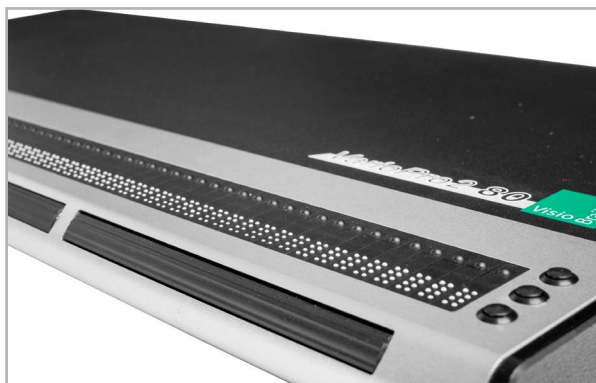
VarioPro bietet eine rutschfeste und großzügig große Fläche für Ihre Tastatur.