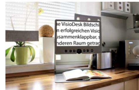
VisioDesk erlaubt den flexiblen Einsatz an unterschiedlichen Orten.