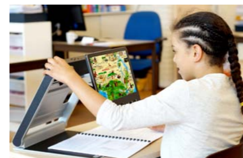
VisioBook HD ist klein, leicht und handlich und ideal für einen mobilen Nutzer.

VisioDesk ist trotz 15,6" Bildschirm kompakt und mit seinem Gewicht von ca. 4,8 kg gut zu tragen. Zudem kann es 5 Stunden netzunabhängig betrieben und in der mitgelieferten Tragetasche verstaut werden. VisioDesk ist somit für denjenigen Nutzer zu empfehlen, der Wert auf eine größere Bildschirmübersicht sowie -vergrößerung legt und im Gegensatz zu fixen Bildschirmlesegeräten die Möglichkeit haben möchte, den Arbeitsort gelegentlich ohne großen Aufwand zu wechseln.